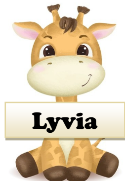
Fille de Arianne Thibault et Cédrik Fontaine