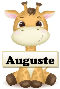
Fils de Mylène Cloutier et Benjamin Cousineau